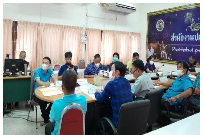
ข่าว : กลุ่มยุทธศาสตร์และสารสนเทศการปศุสัตว์